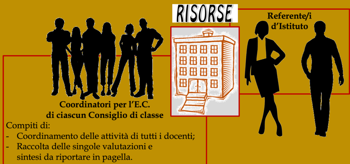
Due anni di IEC: dalle linee progettuali alle pratiche condivise (G. Farci)